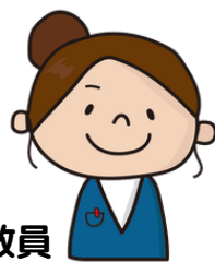
サポートセンター教員