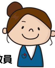
サポートセンター教員

今日の体調はどう？ 学校から届いたプリントで 分からない問題はあったか な。一緒にやってみよう。