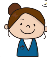
サポートセンター教員