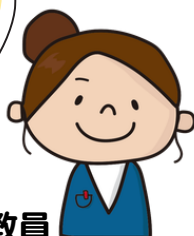
サポートセンター教員

退院後、登校できてい ますか。学校で困ってい ることはありませんか。 何かあれば、いつでも ご相談ください。