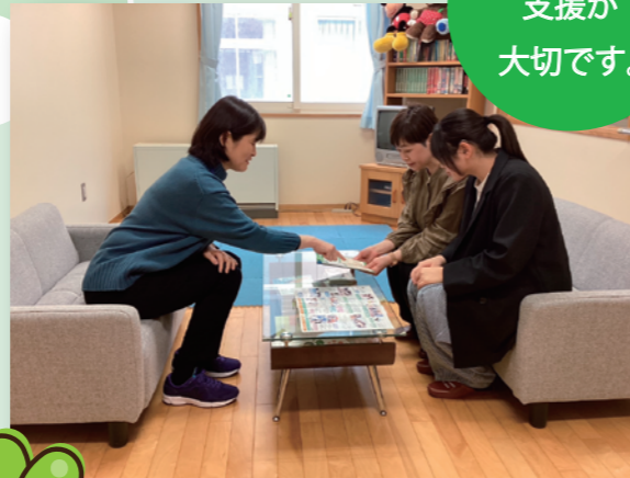
親子でくつろげる相談室でお話をうかがいます。