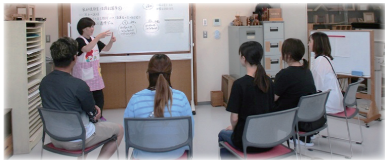
定期的に保護者講座を開催しています。

乳幼児教室には、きこえにくいことが分かって間もない乳幼児(0~2歳)とご家族が来ています。きこえやことばに関する相談や支援とともに、お子さんとご家族が豊かにコミュニケーションできるよう、関わり方などを一緒に考えていきます。