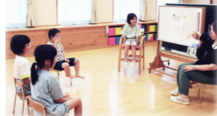
友だちと一緒に活動する機会も設定しています。